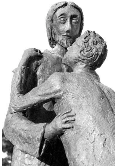
Umarmung – Skulptur Friedhof Sursee

Du gehst nicht in die Fremde. Du bist auf dem Weg zurück in die Heimat. Du gehst zurück in den grossen Kreis Gottes. Möge deine Seele in der Umarmung der Liebe Gottes lächeln.